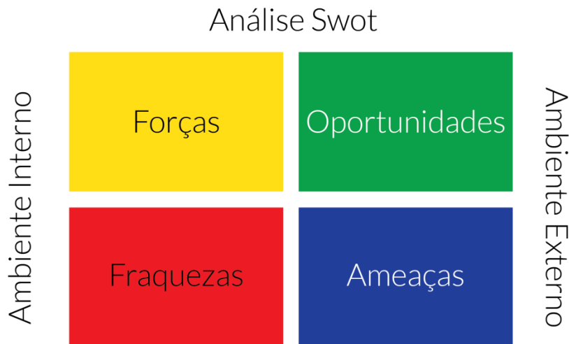
Figura 2 – Exemplo de Quadro de Mapeamento da Matriz SWOT